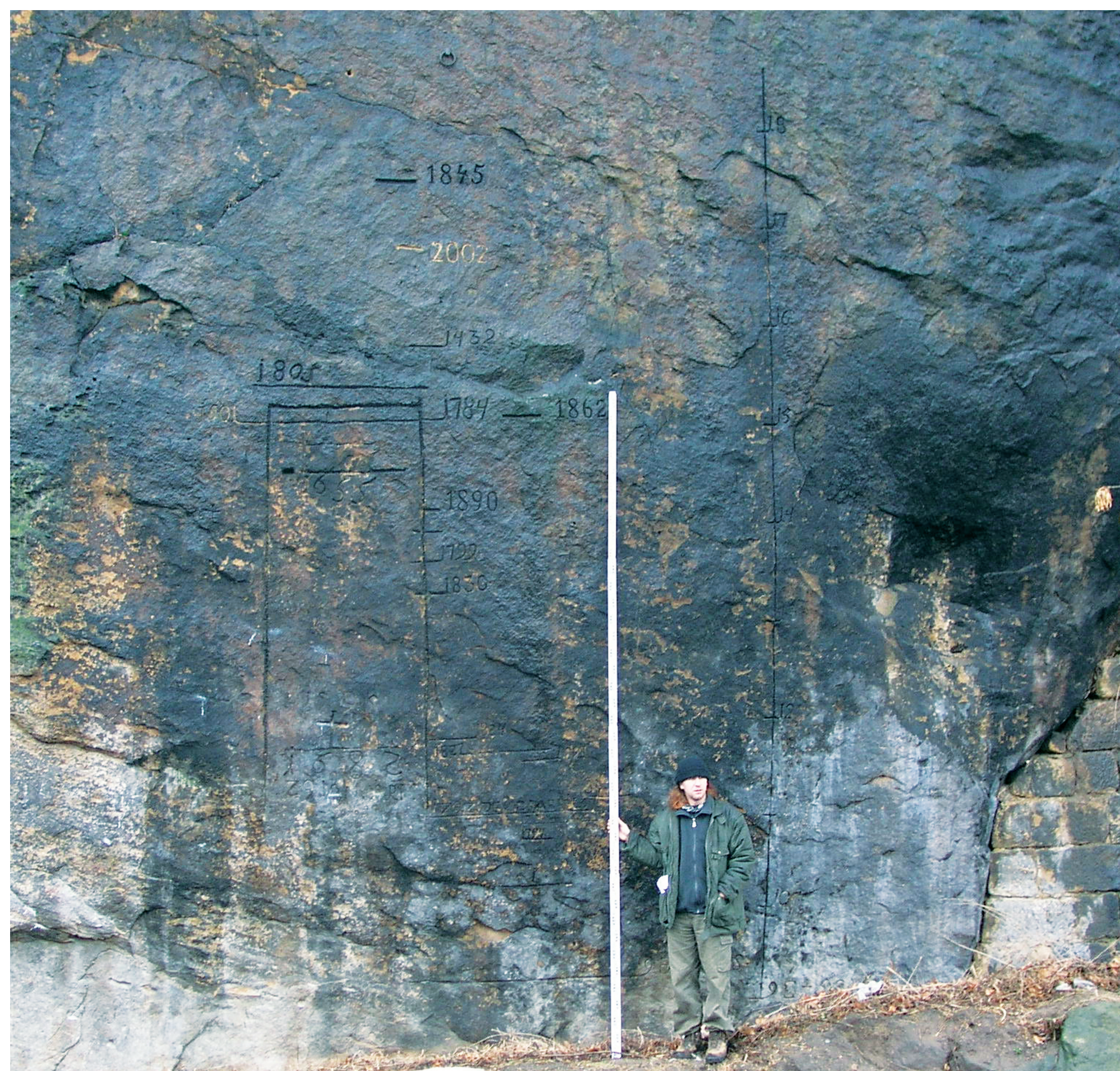
První vodočet v Česku – Děčín.

Zpočátku byly vodní stavy zaznamenávány pomocí vodoměrných značek, které většinou zachycovaly kulminaci větších povodní. Jedním z míst, kde lze nalézt tyto vodoměrné značky je skála v Děčíně, kde také pravděpodobně vznikl i první vodočet v Čechách. Později začaly vznikat vodočty, ze kterých se odečítaly stavy a ty se zapisovaly (to se děje pro kontrolu dodnes).