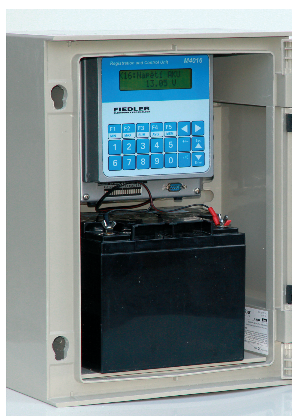
Digitální záznamová jednotka