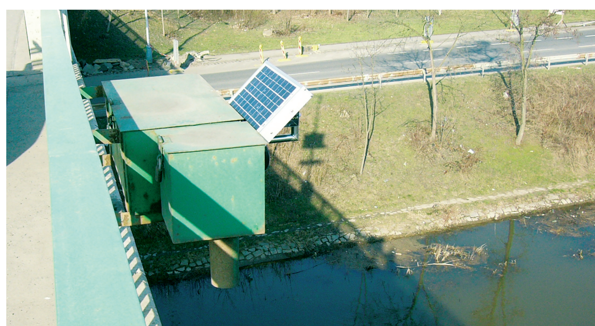
Radarové čidlo – Zbraslav.