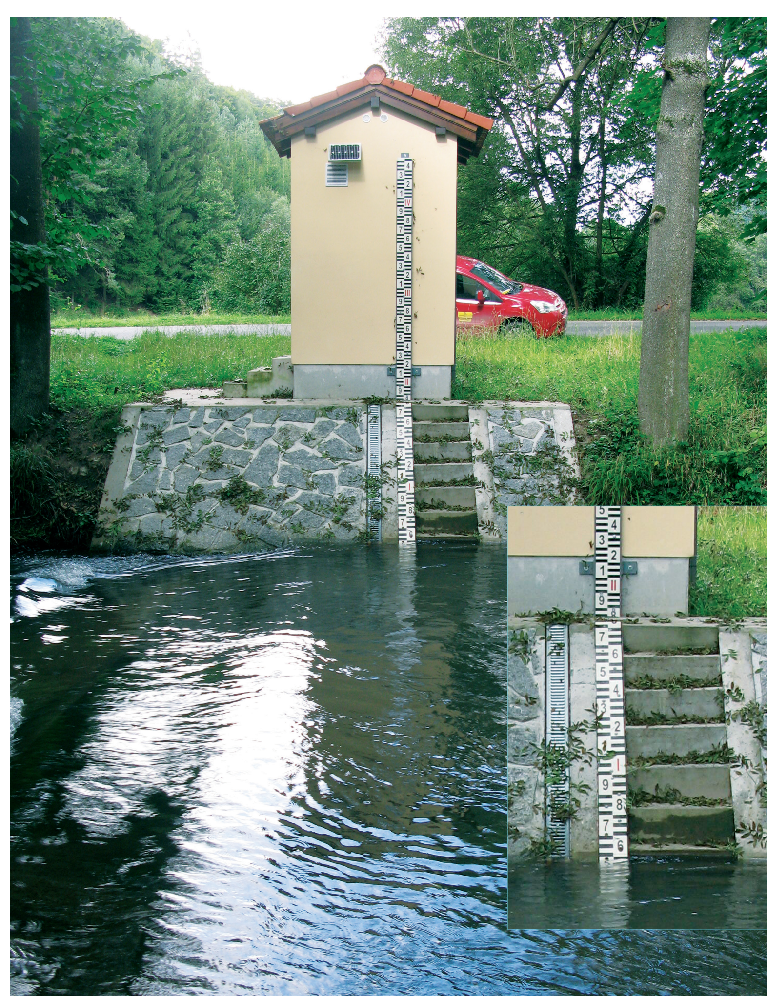
Vodoměrná stanice Chocnějovice.

V současné době se užívají stanice s přenosem dat 1x za 10 minut přes mobilní operátory, ke kterým jdou připojit různé druhy čidel. Nejčastěji jsou používána tlaková čidla (1), plováková (2) a radarová čidla, případně teplotní čidla (3).