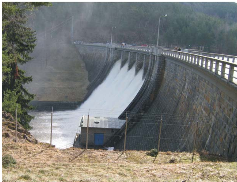
Obr. 45 VD Husinec, 30. března 2006. V povodí Otavy (Blanice) neměla povodeň srovnatelný význam s povodím Sázavy a Lužnice.