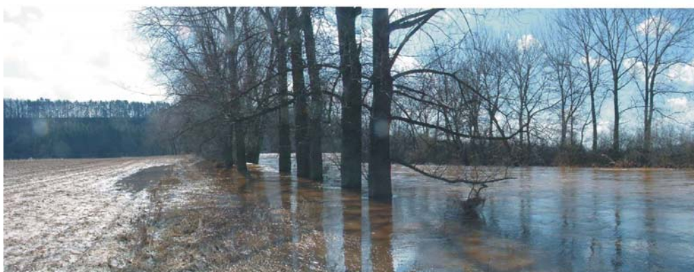
Obr. 24 Předměřice n. Jizerou, 2. dubna 2006 12. h. Profil vodočtu den po kulminaci, pohled proti se stanicí ( v pozadí objekt pražských vodáren). Pohled po vodě poukazuje na levobřežní rozliv pod stanicí.