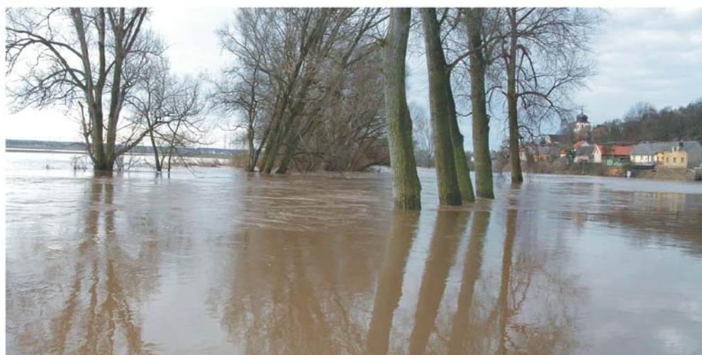
Obr. 25 Dolní Jizera, 2. dubna. Rozlivy Jizery ve vodárenském pásmu (Skorkov) den po kulminaci.