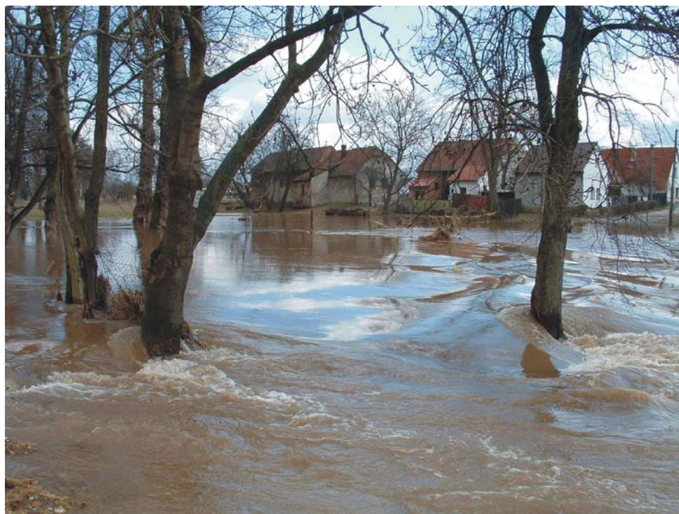
Obr. 26 Benátky nad Jizerou, 2. dubna 2006. Za povodně na jaře 2000 jedno z nejpostiženějších míst. Rameno Jizery v bočním rameni obtéká jez se značným spádem.