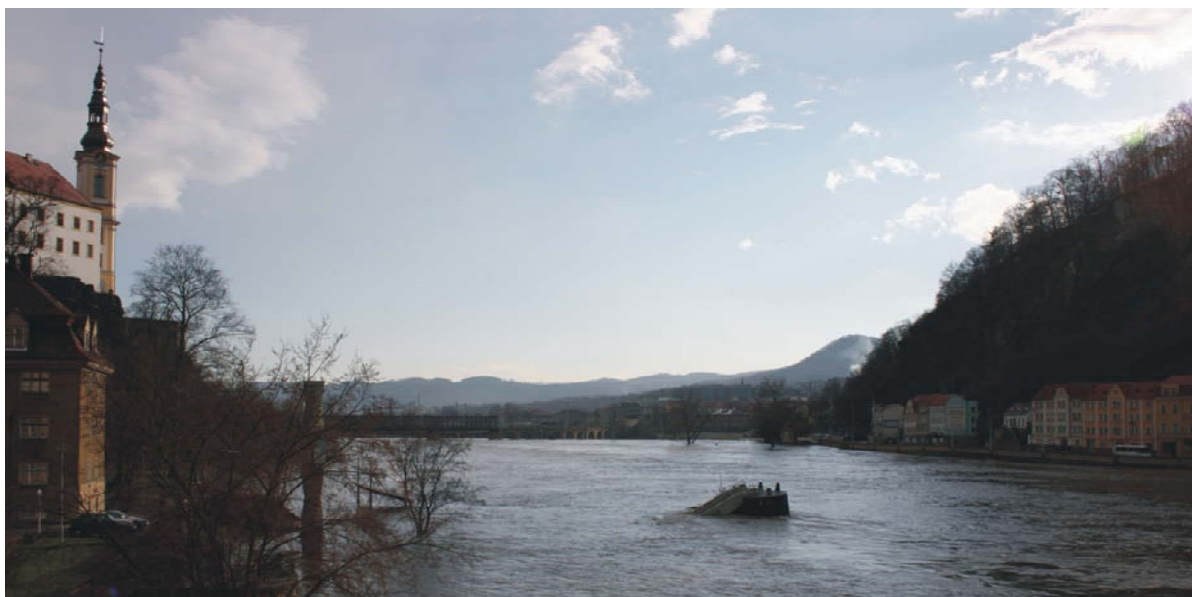
Obr. 76 Děčín, 4. dubna. Pohled proti vodě přes zaplavené nábřeží k zámecké skále.