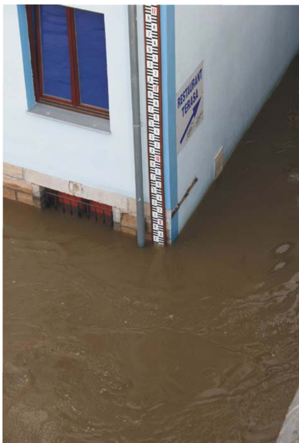
Obr. 77 Děčín, 4. dubna. Mozaika fotografií z měření průtoků v úterý 4. dubna 2006. Zatopená část silnice na levém břehu, měření průtoků s pomocí ADCP a vodočet na pravém břehu (též šipka) za stavu 870 cm, (kulminace dosažena na úrovni 887 cm), Foto: Kurka, D.