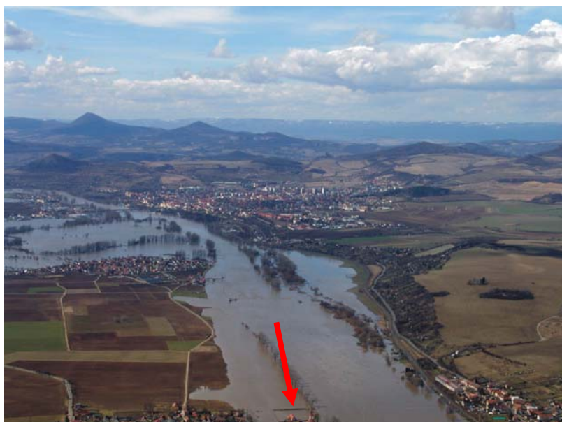
Obr. 74 Počaplechy, 2. dubna 2006. Rozlivy na soutoku Ohře s Labem, vpravo Litoměřice, v popředí častěji zatápěný kostel v Počaplech. S tímto objektem je spojena dlouhá řada záznamů o povodních, jejichž počátek spadá do konce 18. století, (Brázdil, 2005).