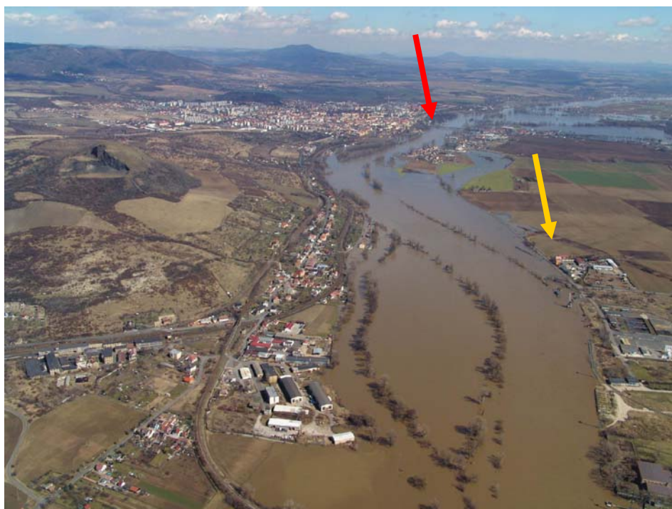
Obr. 73 Žalhostice, Pišťany (vlevo) a Lovosice, Prosmyky (vpravo) 2. dubna 2006. Pohled od České brány na úsek Labe od soutoku s Ohří, Litoměřice a na levém břehu obec Mlékojedy (červená šipka). Jako při řadě dřívějších významnějších povodní byly Mlékojedy obklopeny vodou. Kaple v Prosmykách na okraji zátopy (žlutá šipka) se zaměřenými, ale po povodni v roce 2002 již neobnovenými historickými povodňovými značkami.