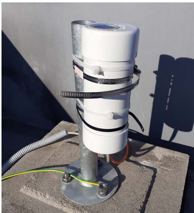
Obr. 2 Jasoměr LE (SQM-LE) na meteorologické observatoři Praha-Libuš.

Fig. 1. Map of nighttime light sources – median for 2024 with DOS correction from satellite data (VIIRS/NOAA) over the territory of the Czech Republic. Author: Lucie Marková.