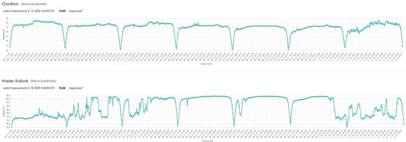
Obr. 3 Grafy zobrazují průběh naměřeného jasů noční oblohy (v mag/arcsec 2 ) v lokalitách Churáňov (horní graf) a Nový Hradec Králové (dolní graf), v průběhu jednoho týdne. Na ose x je čas (UTC), na ose y hodnota jasů (Kohout 2025).

Fig. 3. The graphs show the measured night-sky brightness (in mag/arcsec 2 ) at Churáňov (upper graph) and Nový Hradec Králové (lower graph) over the duration of one week. The x-axis shows time (UTC), and the y-axis shows brightness values (Kohout 2025).